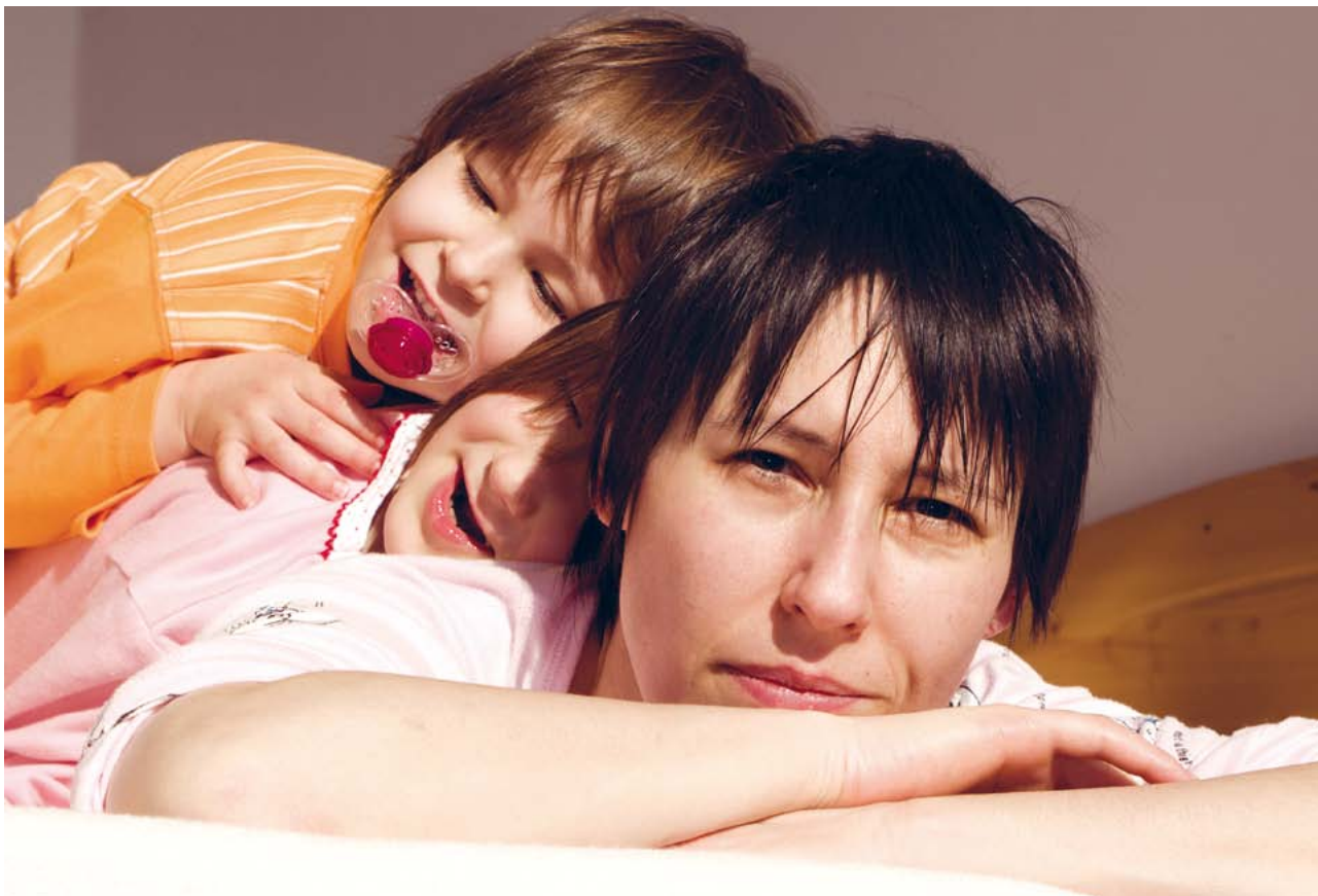
Mit Unterstützung erreichen Eltern ein hohes Maß an Selbständigkeit und Sicherheit im Umgang mit ihren Kindern.