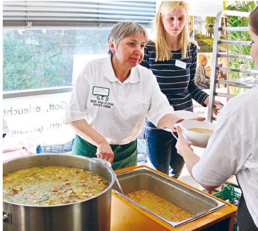
Armen Menschen eine warme Mahlzeit geben, das wollten Mitarbeiterinnen und Mitarbeiter aus dem Berliner St. Elisabeth-Stift beim Weltgebtag der Frauen.

Den diesjährigen Weltgebtag der Frauen am 4. März nahmen Mitarbeiterinnen der Berliner Altenpflegeeinrichtung St. Elisabeth-Stift (Prenzlauer Berg) zum Anlass, die nahe gelegene Suppenküche des Franziskanerordens in Pankow zu unterstützen.