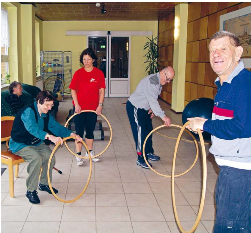
Bewegung mit Musik in vertrauter Gemeinschaft: In Heilbrunn gehören sportliche Angebote zum Alltag der Menschen mit geistiger Behinderung.