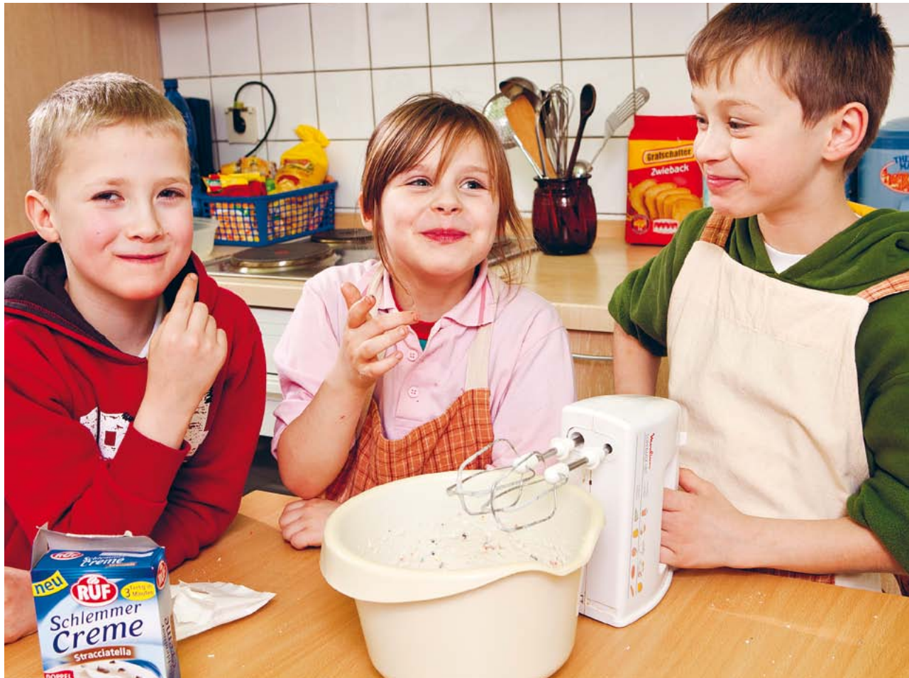
Es gibt ganz viele Möglichkeiten und Wege, Kinder in ihren Problemsituationen zu erreichen. Im Mittelpunkt steht immer das Ziel, sie dabei zu ermutigen, ihre Gaben und Talente auszuprobieren und sie einfach so anzunehmen, wie sie sind.

Cindy und Bert beim Open-Air-Konzert am 24. Juni in Weißensee ..... Seite 6