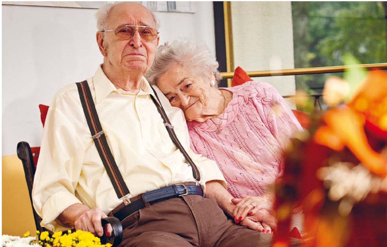
Lieben und geliebt werden ist in jeder Lebensphase ein sehr hohes Gut