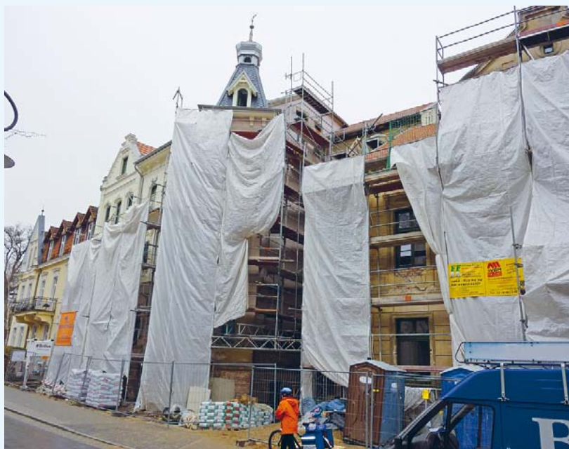
Barrierefreie Wohnungen entstehen in Bad Freienwalde

In Bad Freienwalde (Landkreis Märkisch Oderland) beteiligt sich die St. Elisabeth Diakonie gGmbH an zwei neuen Wohnprojekten für Senioren. Dazu werden zwei alte Häuser in der Kurstadt von Investoren saniert und barrierefrei umgebaut. Inhaltliche Beratung kam dabei von den Fachleuten der St. Elisabeth Diakonie gGmbH, einer Tochtergesellschaft der Stephanus-Stiftung. Die komfortablen Wohnungen mit Größen zwischen 39 und 85 Quadratmetern in der Beethovenstraße und in der Gesundbrunnenstraße sollen in diesem und im nächsten Jahr bezugsfertig sein und stehen dann älteren oder behinderten Menschen zur Verfügung. Die St. Elisabeth Diakonie gGmbH wird den neuen Mietern verschiedene Dienstleistungen anbieten, wie Betreuung, Pflege, Mittagessen oder Begleitung zu Ärzten und Behörden. ○ (MJ)