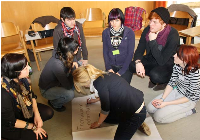
Bei internationalen Workshops verändern junge Menschen ihre Einstellung zum Thema Migration und soziale Arbeit.