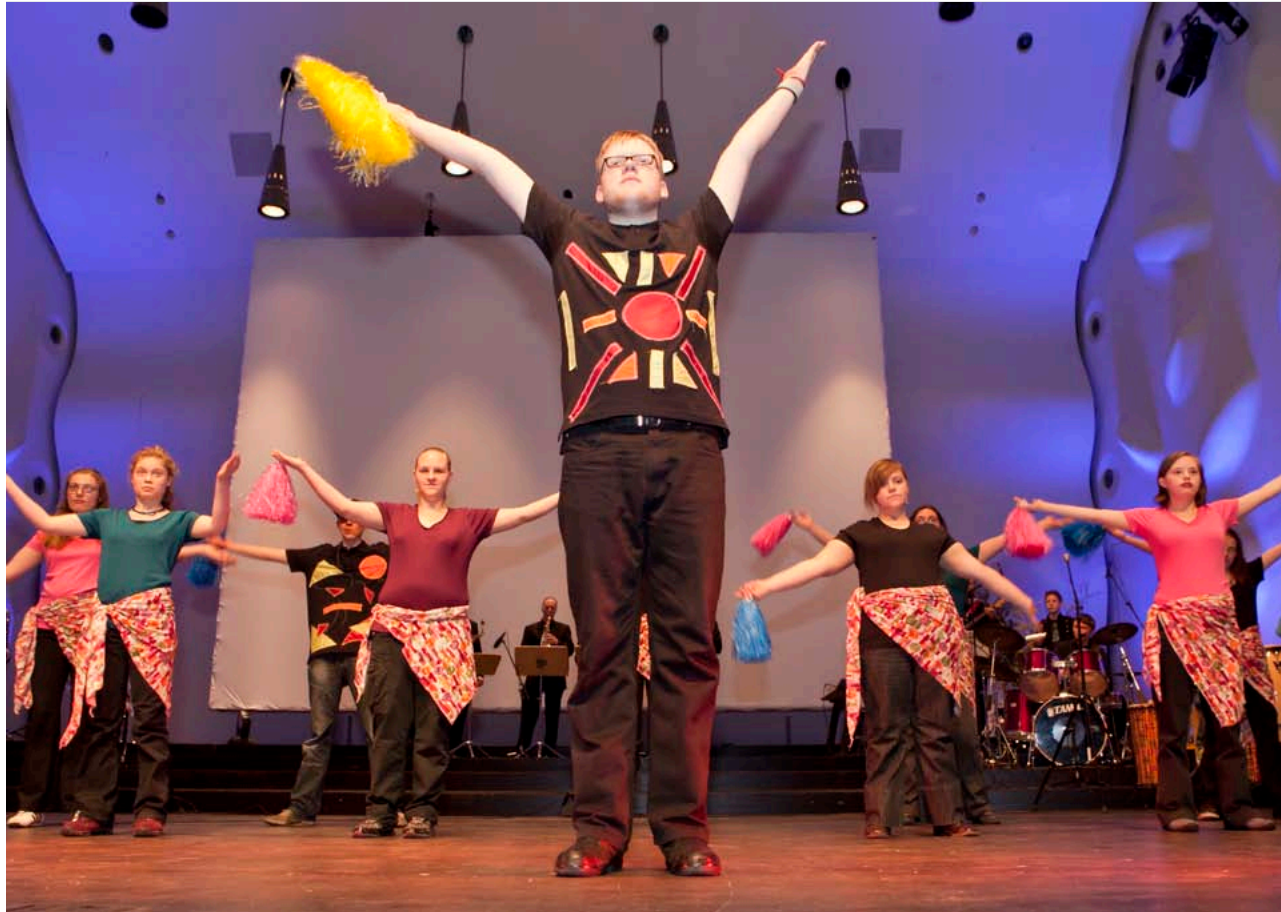
Zum dritten Mal beeindruckten junge Talente aus Hoffbauer-Schulen bei der Hoffbauer Gala im Potsdamer Nikolaisaal. Mit dem Erlös der Veranstaltung, 6.800 Euro, unterstützen die jungen Talente den Bau des zukünftigen stationären Hospizes auf Hermannswerder. (Siehe Beitrag Seite 4)

Filmkulisse Elisabeth-Stift Julia Richter dreht Weihnachtsgeschichte in Seniorenzentrum ..... Seite 6