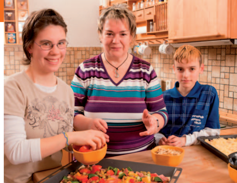
In Petersdorf finden acht Kinder mit problematischen Lebenserfahrungen ein behütetes Zuhause und leben sehr familiär zusammen.