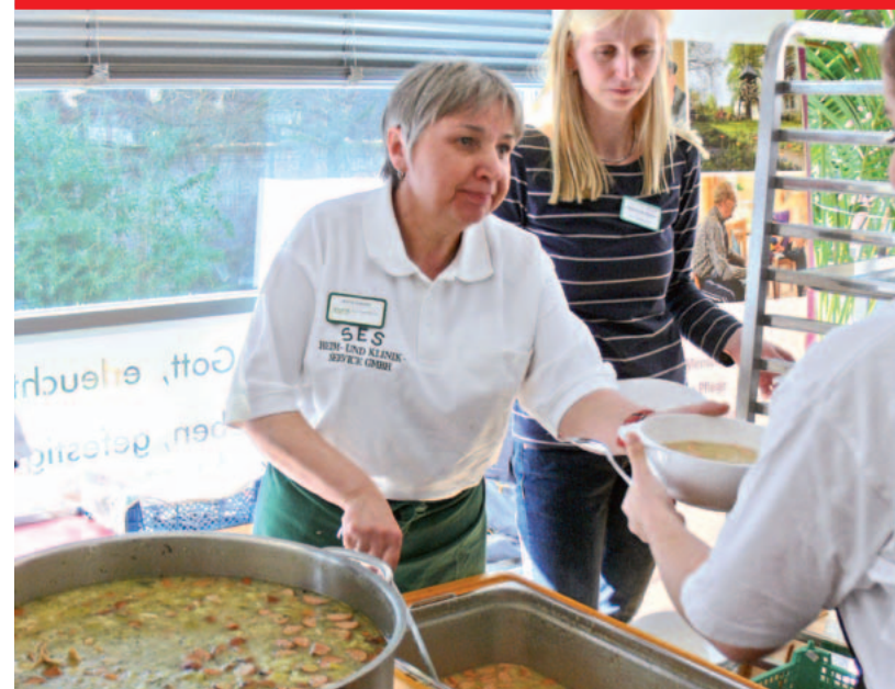
Armen Mitmenschen eine warme Mahlzeit geben, das wollten Mitarbeiterinnen und Mitarbeiter aus dem Berliner St. Elisabeth-Stift und der SES Klinikservice GmbH beim Weltgebetstag.