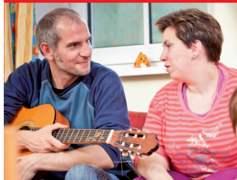
Menschenbild und Menschenwert im Lichte Gottes sehen. Ein Foto aus dem Lebensalltag der Wohneinrichtung Biberbau, in der Menschen mit geistiger Behinderung begleitet werden.