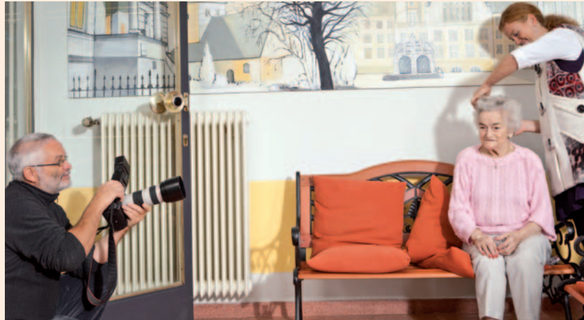
Mit der Aufnahme in die Familie bekam die Stephanus-Gesellschaft ein neues Gewand: Dafür wurden u.a. im Stephanus-Seniorenzentrum Reineckendorf neue Fotos gemacht. (l.) Die Kinder- und Jugendhilfe macht unter dem neuen Namen „firmaris“ auch jungen Eltern Mut: zum Beispiel im Verbund für Hilfen zur Erziehung in Strausberg. (u. l.) Die Kinder der Hoffbauer-Kita „Kleine Fische“ in Oranienburg lernen immer wieder Neues. Einmal im Monat kochen sie mit einem Profi. (u. r.)

Mutig und richtig erwies sich auch der Umbau des über 100 Jahre alten „Rothen Hauses“ in Brüssow (Landkreis Uckermark), um dort 13 barrierefreie Wohnungen mit Service für Senioren anzubieten. Mit viel